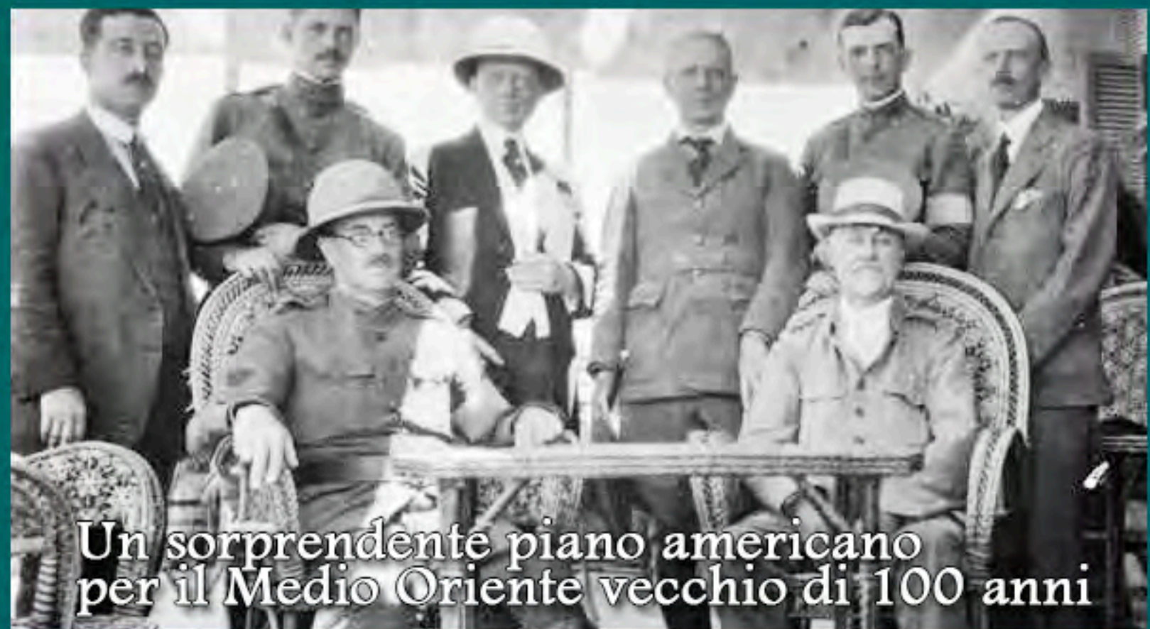
Un sorprendente piano americano per il Medio Oriente vecchio di 100 anni