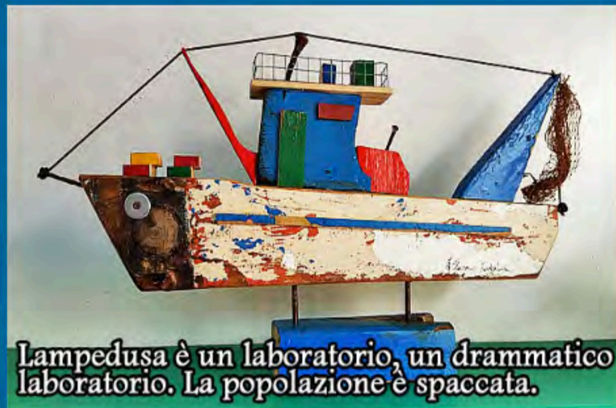
Lampedusa è un laboratorio, un drammatico laboratorio. La popolazione è spaccata.