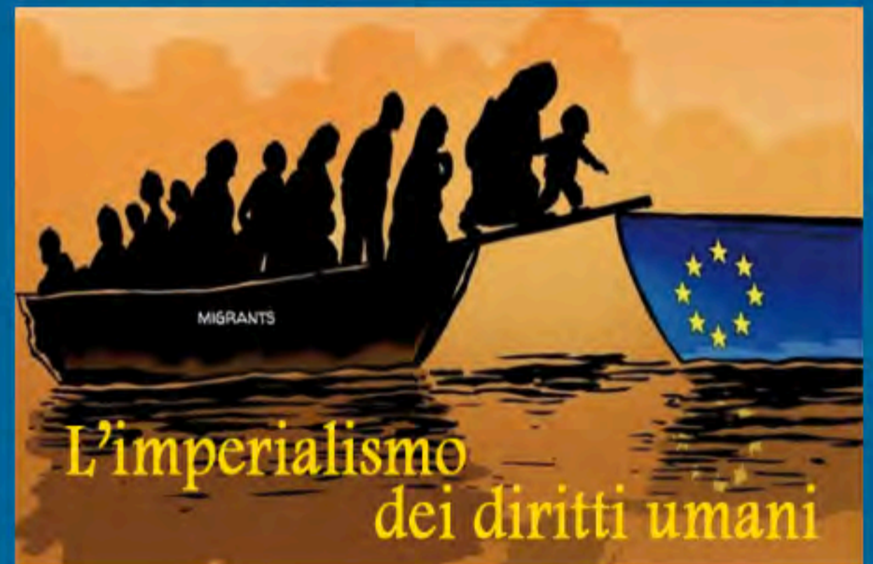
L'imperialismo dei diritti umani