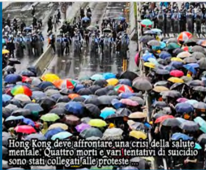
Hong Kong deve affrontare una crisi della salute mentale. Quattro morti e vari tentativi di suicidio sono stati collegati alle proteste ....