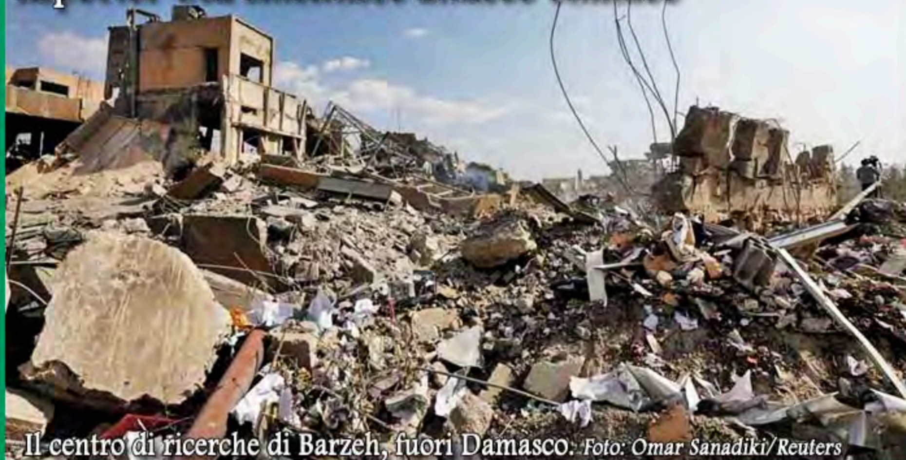
Il centro di ricerche di Barzeh, fuori Damasco.