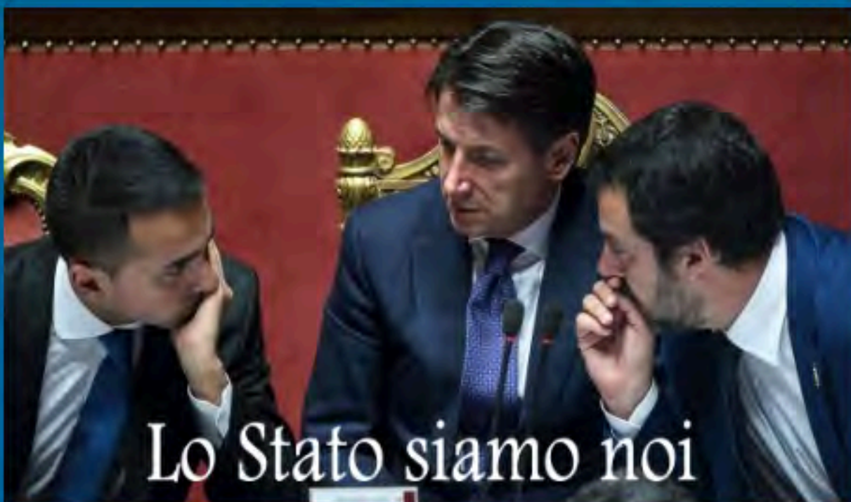
Lo Stato siamo noi