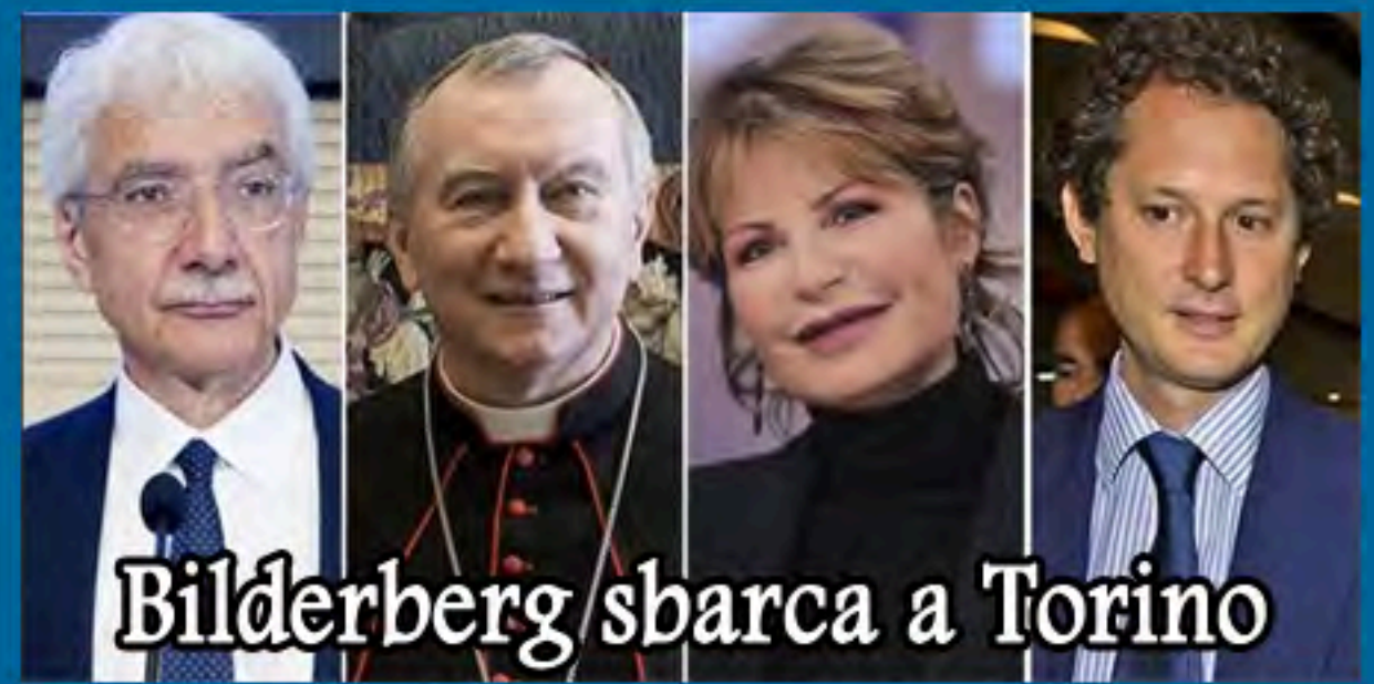
Bilderberg sbarca a Torino