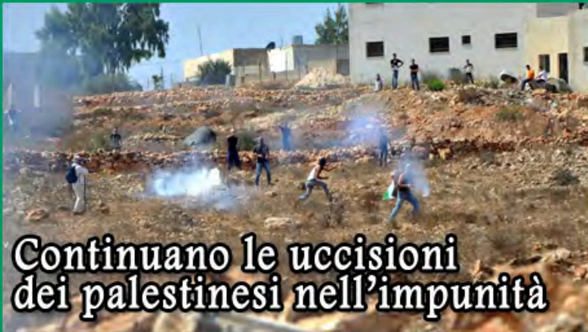
Continuano le uccisioni dei palestinesi nell'impunità