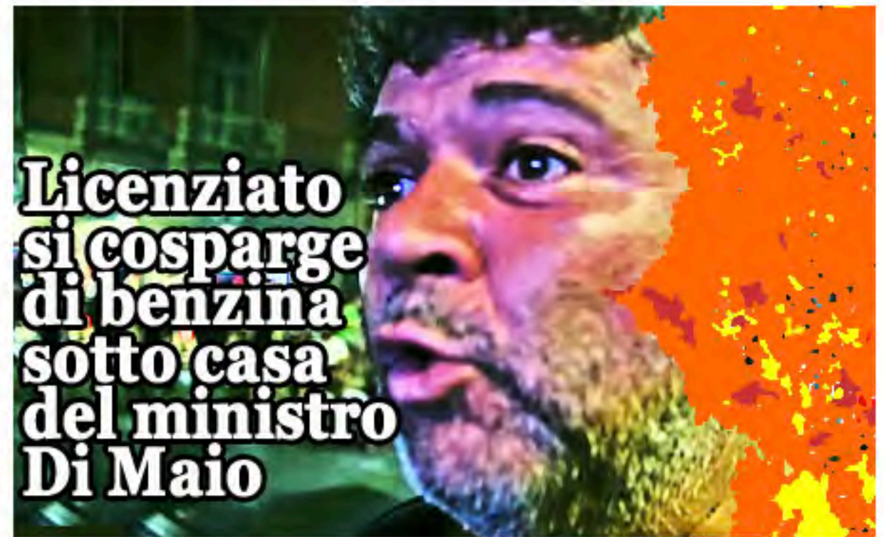
Licenziato si cosparge di benzina sotto casa del ministro Di Maio